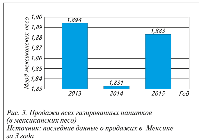
Рис. 3. Продажи всех газированных напитков (в мексиканских песо)

На графике продаж всех видов газировки (рис. 3) разрыв акцентирован так же: ось Y начинается не с нуля, чтобы можно было заметить разницу. Проектеры, которым мексиканский опыт всё ещё кажется образцом успешного вмешательства в народное здравоохранение, должны осознать, как дорого это обошлось гражданам. Получив 20 миллиардов песо