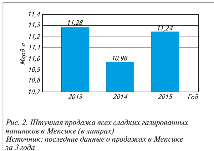
Рис. 2. Штучная продажа всех сладких газированных напитков в Мексике (в литрах)